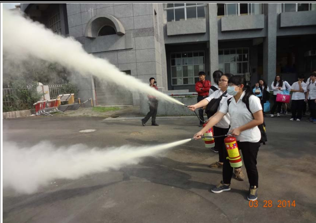
學生在消防警員指導下進行滅火實作演練