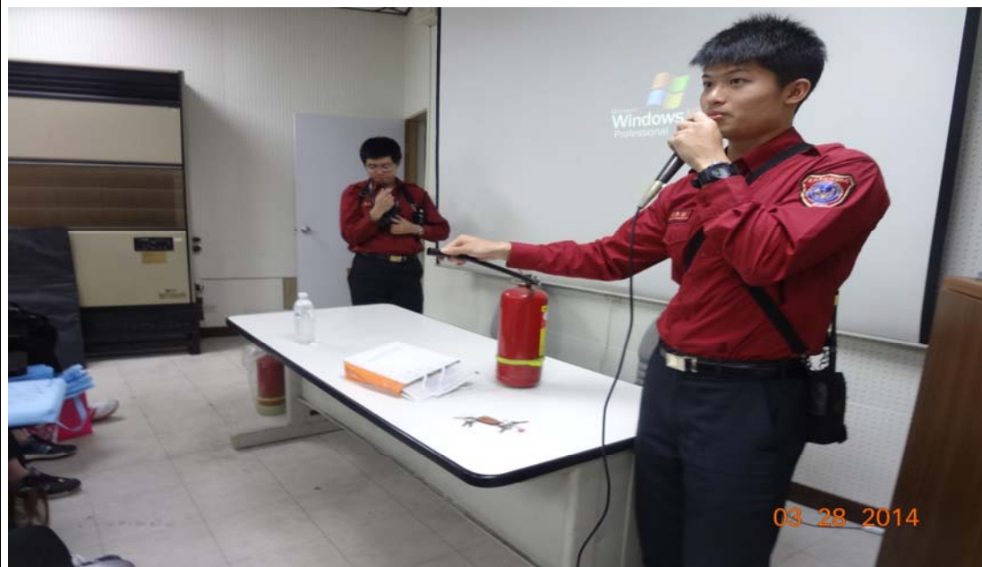
士林劍潭分隊進行防火暨防災宣導